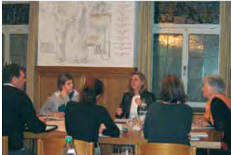
Arbeit in der Projektgruppe