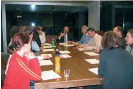
Arbeitsgruppen am Startworkshop