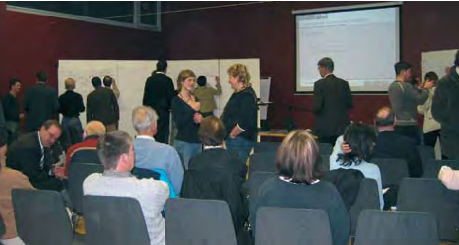
Festhalten der Ergebnisse aus dem Startworkshop